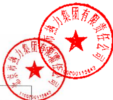
附表 3：定标决议记录表