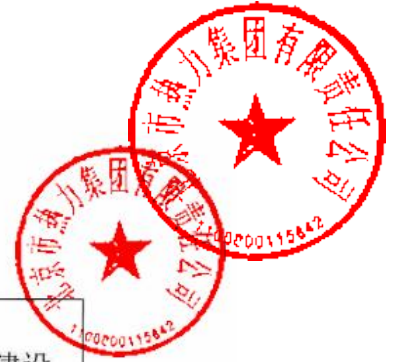
附件 4：答辩情况记录表