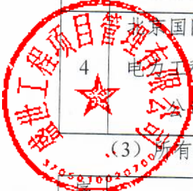
(3) 所有投标人总得分情况