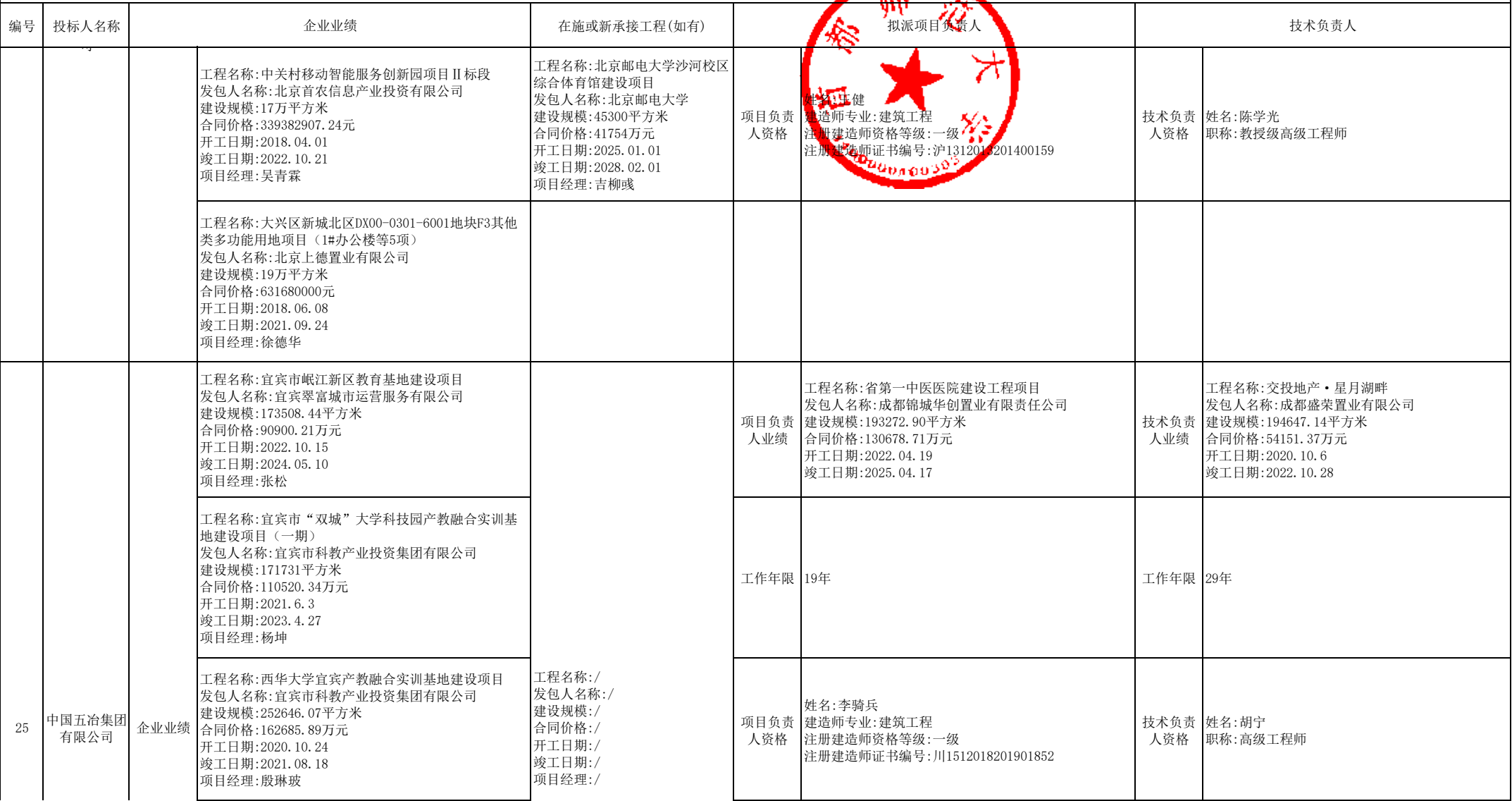
合格申请人商务信息公示表