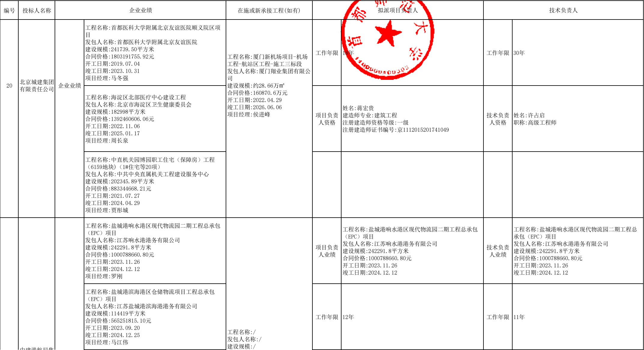
合格申请人商务信息公示表