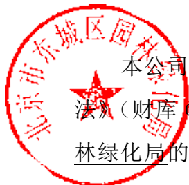
表 13--中小企业声明函格式

本公司（联合体）郑重声明，根据《政府采购促进中小企业发展管理办法》（财库〔2020〕46 号）的规定，本公司（联合体）参加北京市东城区园林绿化局的 2025 年东城区全龄友好公园改造工程 采购活动，工程的施工单位全部为符合政策要求的中小企业（或者：服务全部由符合政策要求的中小企业承接）。相关企业（含联合体中的中小企业、签订分包意向协议的中小企业）的具体情况如下：