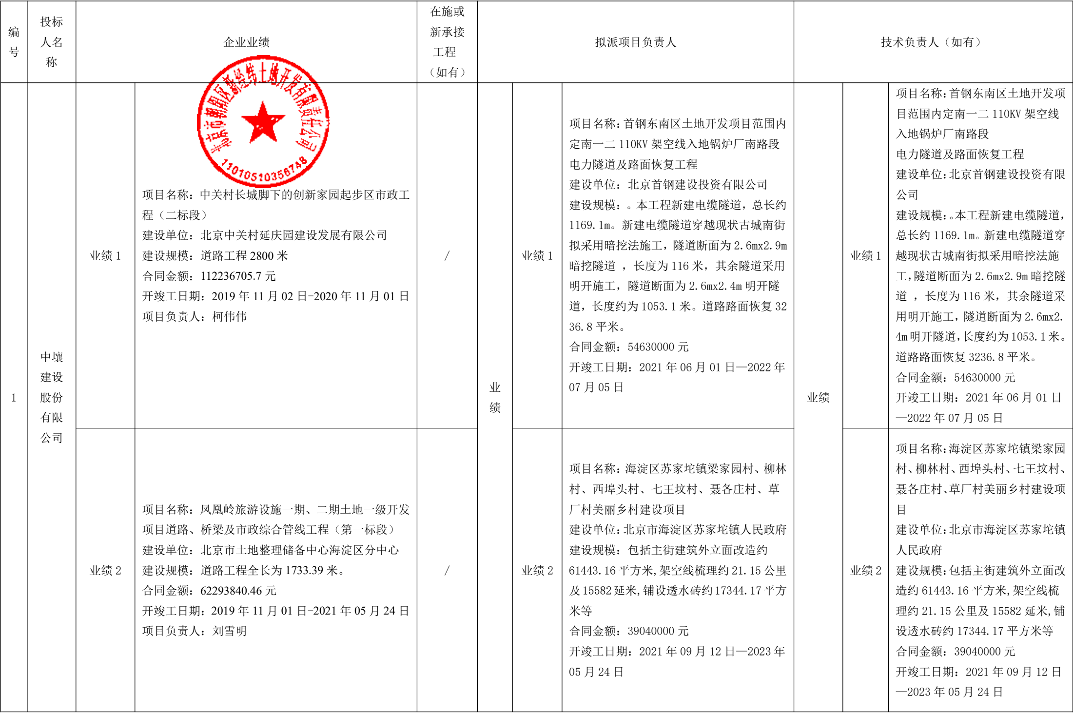
投标人商务信息公示表