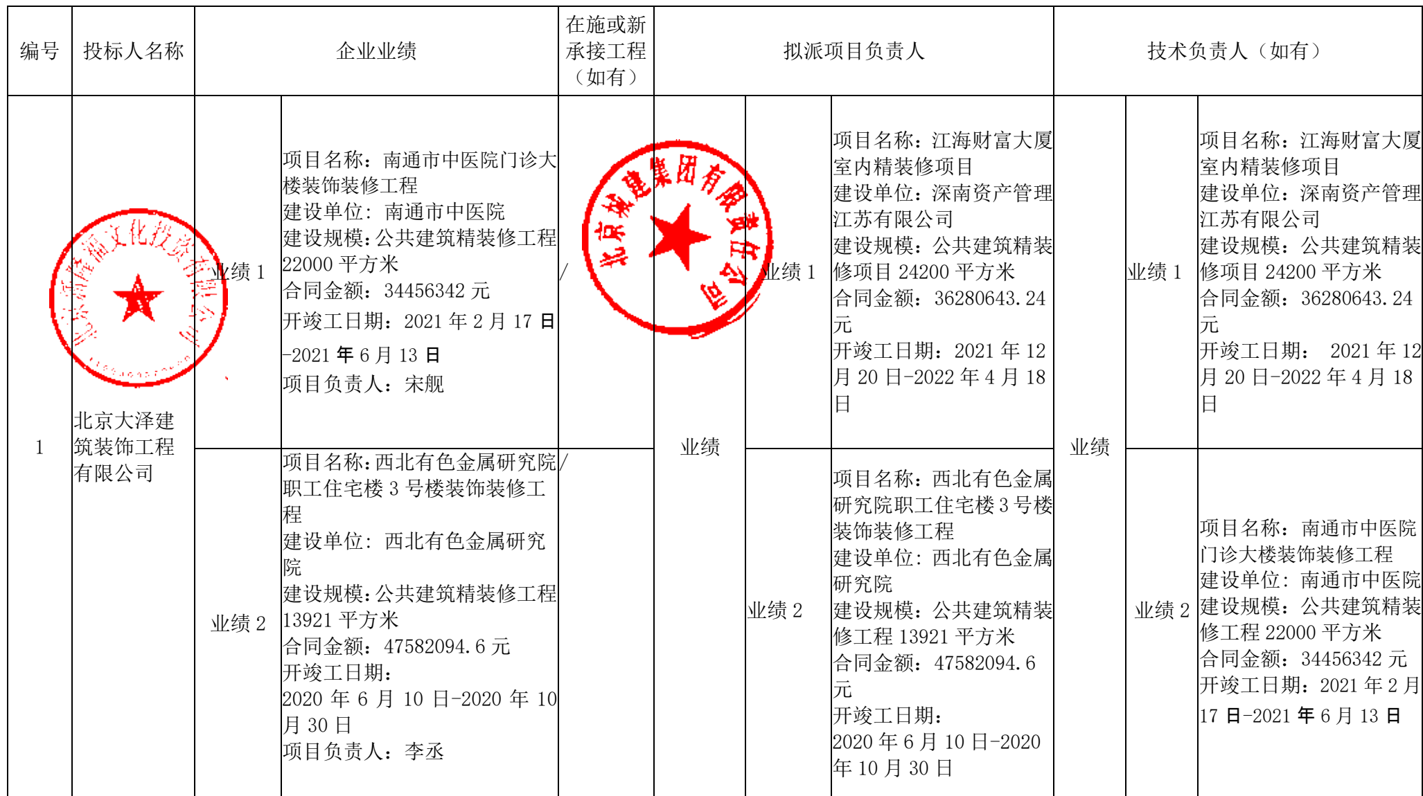
投标人商务信息公示表